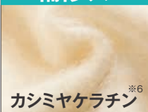
カシミヤセラチン ※6